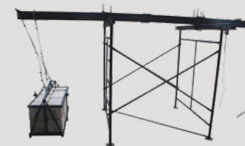
Cavelete com Contra-peso